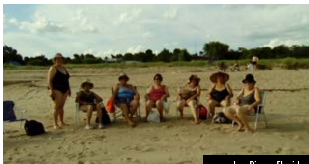
Los Pinos, Florida