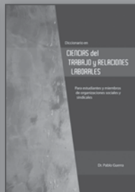
Dicc. Ciencias del Trabajo y Relaciones Laborales