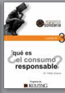
Cartillas: Economía Solidaria, Familia, Medios de comunicación