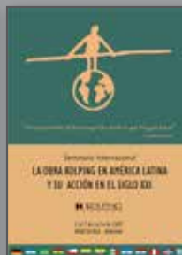
La Obra Kolping en América Latina y su acción en el siglo XXI