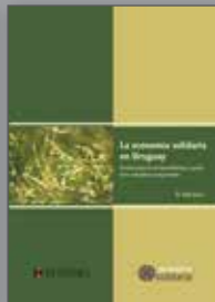
La Economía Solidaria en Uruguay