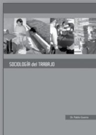
Sociología del Trabajo