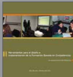
Herramientas para el diseño e implementación de la Formación basada en Competencias