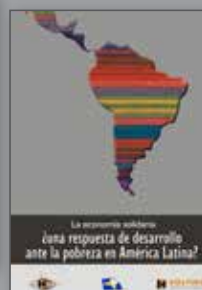
Una respuesta de desarrollo ante la pobreza en América Latina