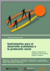
Instrumentos para el desarrollo económico y la protección social