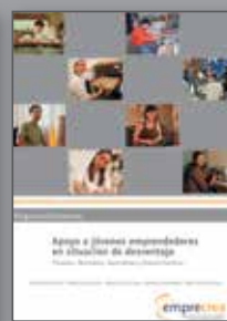
Apoyo a jóvenes emprendedores en situación de desventaja