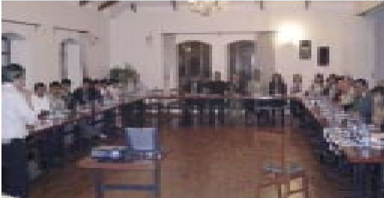
El salón de reuniones al comenzar el seminario

Espero que tengamos una reunión exitosa e interesante. Gracias por su atención.