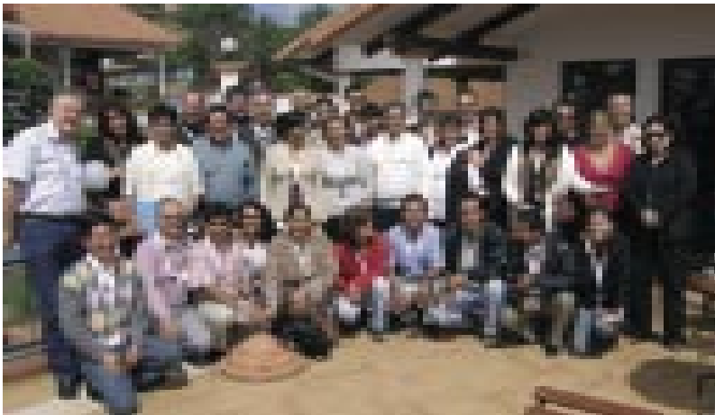
Los delegados participantes del seminario