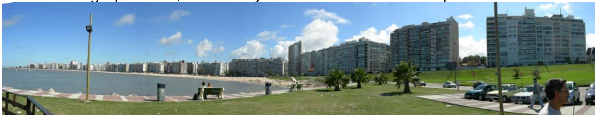
Rambla de Montevideo

El turismo agropecuario, histórico y termal también tiene importancia.