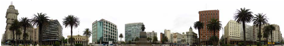
Centro de la ciudad de Montevideo

Cuchilla de Haedo y a la Cuchilla Grande. Su punto más elevado es el cerro Catedral, con 514 metros.